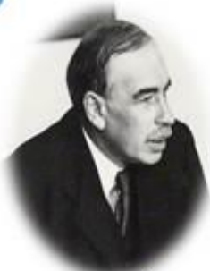
จอห์น เมย์นาร์ด เคนส์ JOHN MAAYNARD KEYNES

ชาวอังกฤษ ผู้เขียนหนังสือ "THE WEALTH OF NATIONS" และเสนอ นโยบายเสรีนิยม (LAISSEZ FAIRE) ที่ เห็นว่ารัฐบาลควรเข้ามาแทรกแซง ระบบเศรษฐกิจให้น้อยที่สุด ซึ่งท่าน ได้รับการยกย่องว่าท่านเป็นบิดาของ วิชาเศรษฐศาสตร์