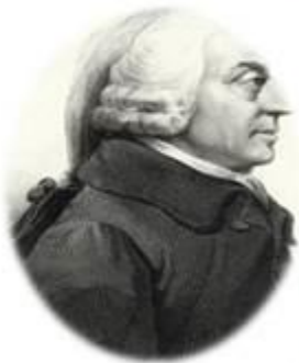
อาดัม สมิท ADAM SMITH

ชาวอังกฤษ ผู้เขียนหนังสือ "THE WEALTH OF NATIONS" และเสนอ นโยบายเสรีนิยม (LAISSEZ FAIRE) ที่ เห็นว่ารัฐบาลควรเข้ามาแทรกแซง ระบบเศรษฐกิจให้น้อยที่สุด ซึ่งท่าน ได้รับการยกย่องว่าท่านเป็นบิดาของ วิชาเศรษฐศาสตร์